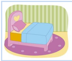
ห้องนอน ห้อง