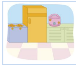
ครัว ห้อง