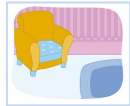
นั่งเล่น