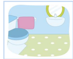
ห้องนอน ห้องครัว ห้องนั่งเล่น ห้องน้ำ